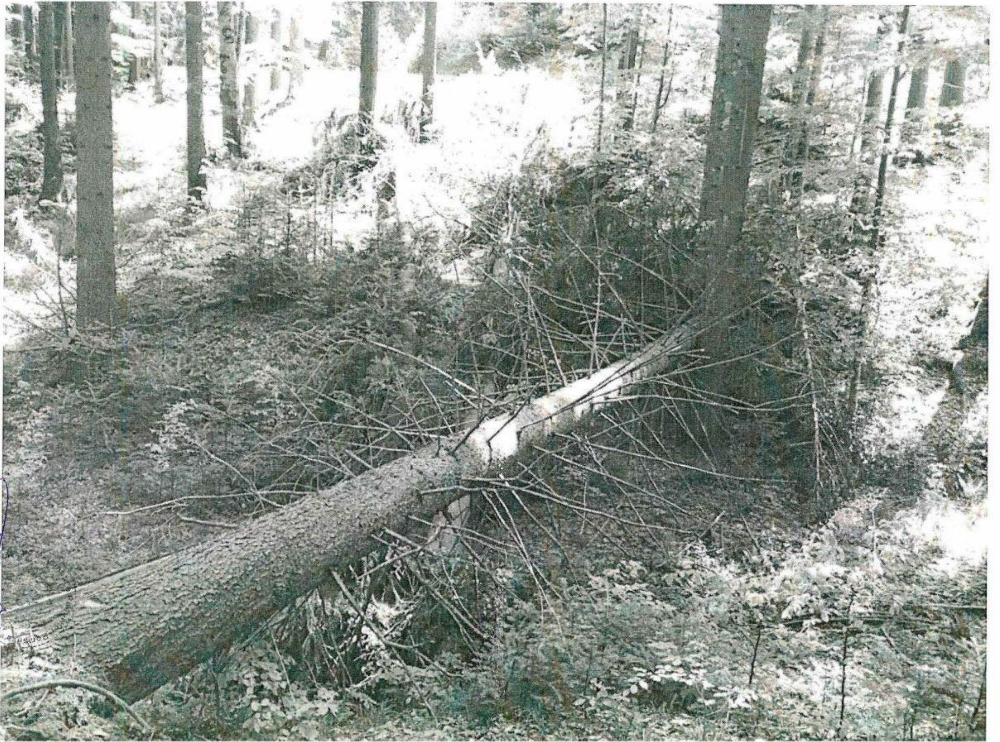
Parida m. 4 Ael Canale Biscia